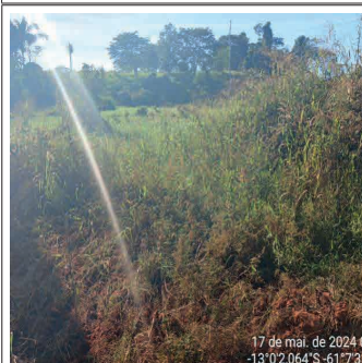
FIGURA 05 - Local consolidado ao lado da edificação