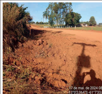
FIGURA 04 - Atividades de pavimentação sendo realizadas