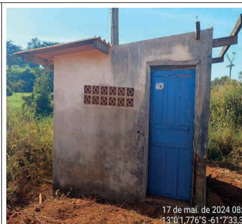
FIGURA 02 - Edificação (casa de máquinas)