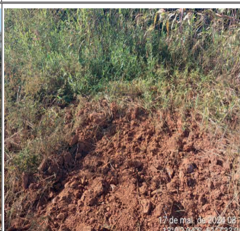
FIGURA 06 - Local consolidado ao lado da edificação