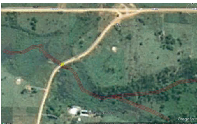
Google Satélite 25/05/2007

A área de interesse para implantação de edificação de casa de máquinas com finalidade de atividade de captação de água superficial do corpo hídrico para abastecimento da população do distrito de Vitória da União, considerada de Interesse Social, é caracterizada como Área Consolidada, devido a antropização realizada anterior a 22 de julho de 2008 e apresenta característica de bioma de amazônico, que sofre alagamento em períodos sazonais devido às características de drenagem natural do percurso hídrico, que pode ser observado através de análise da imagem a seguir: