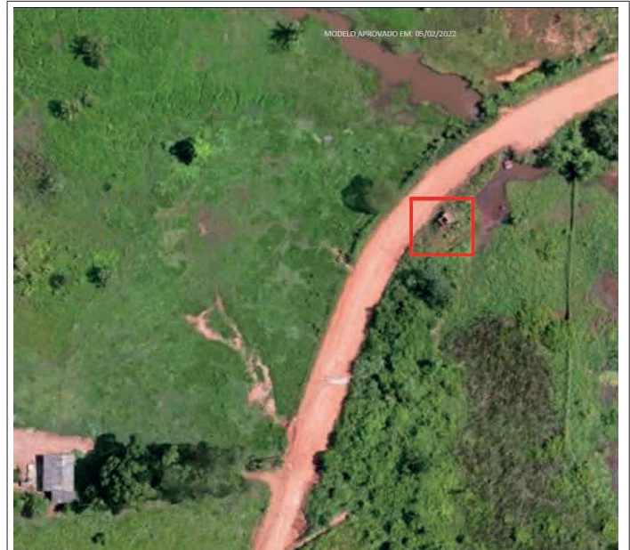
FIGURA 07 - Local consolidado ao lado da edificação

Conforme observado a edificação está localizada no local de passagem da pavimentação e elemento de drenagem (galeria), sendo evidenciada a necessidade de deslocar a construção. Destacamos que toda a área do entorno encontra-se consolidada, possibilitando tal intervenção. Cumpre ressaltar que tal pavimentação beneficiará em média 1.500 famílias que residem/transitam pelo Distrito de Vitória da União, sendo este o principal acesso ao local.