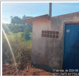
FIGURA 01 - Edificação (casa de máquinas)

Considerando a solicitação para verificação dos condicionantes requeridas pela Prefeitura Municipal de Corumbiara/RO, procedemos com vistoria "in loco" conforme demonstrado nas imagens abaixo: